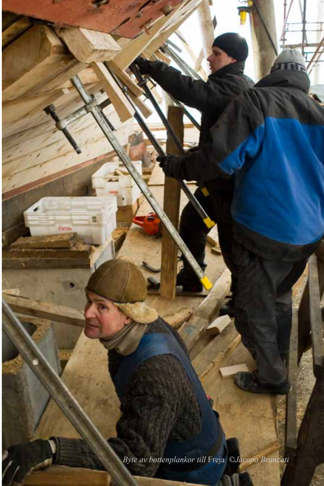
Byte av bottenplankor till Freja