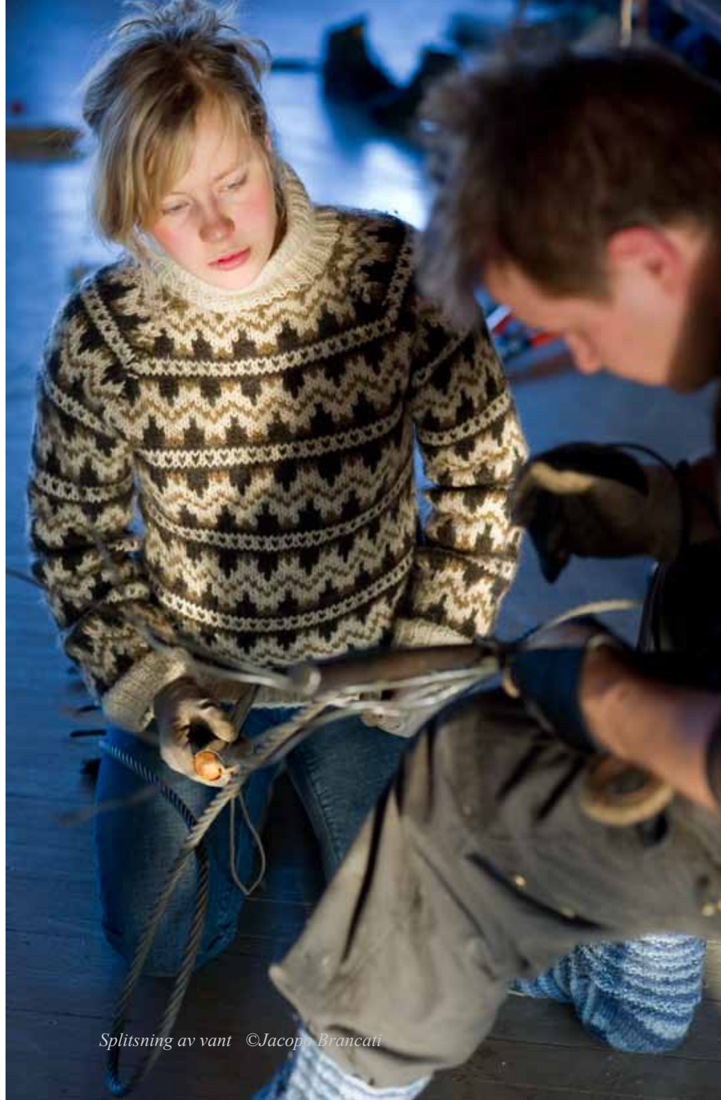
Splitsning av vant

Alla bilder och videoklipp är tagna av Jacopo Brancati. Musiken har komponerats och spelats av Arja Kastinen som också gör ljudinstallationen.